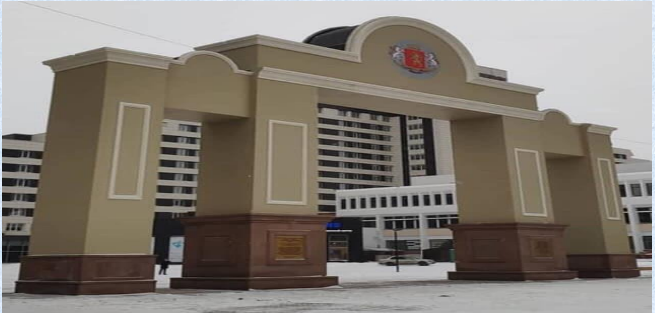
Триумфальная арка после реставрации.