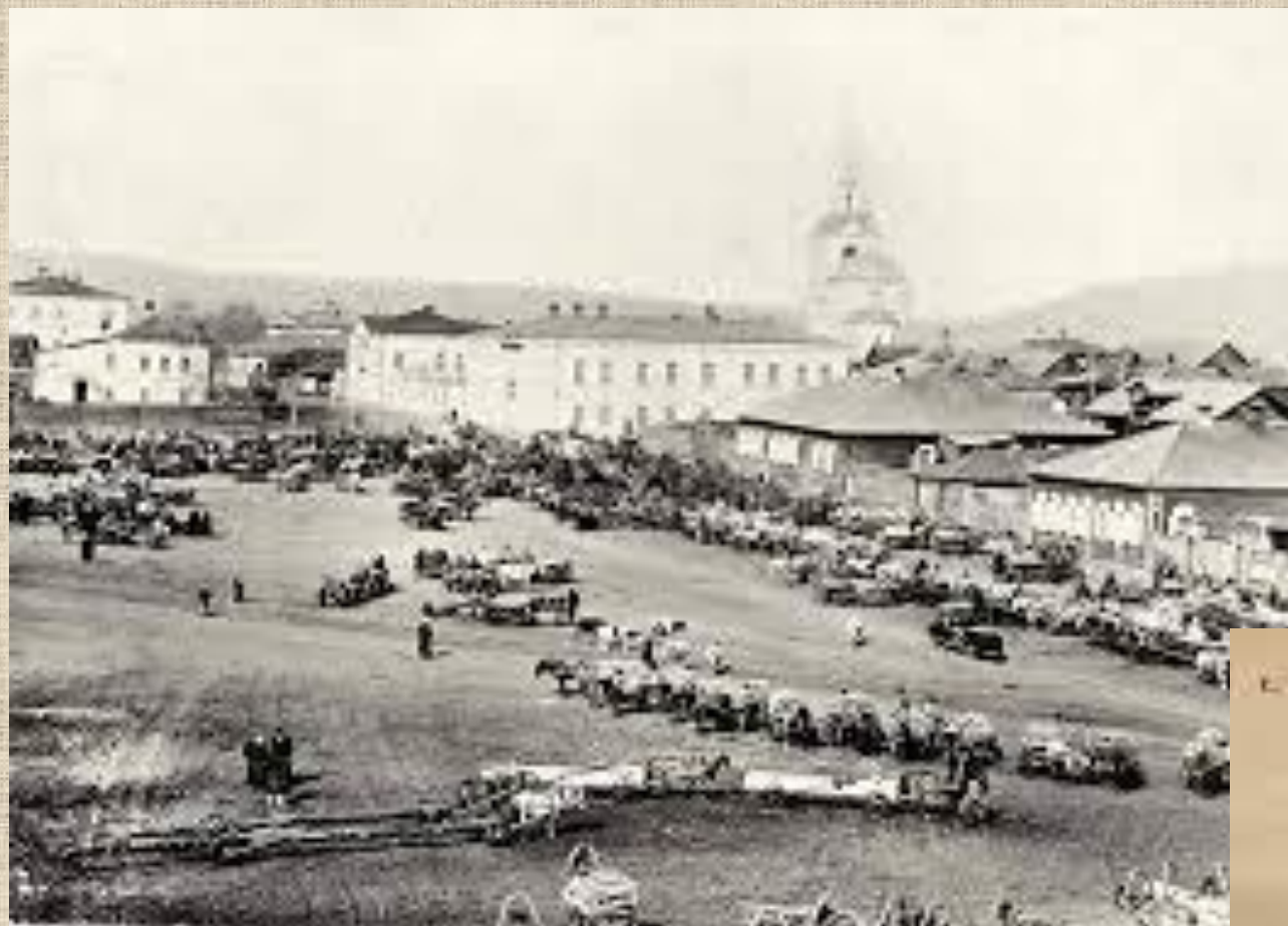
г. Красноярскъ, Архирейскій дворъ, № 8.